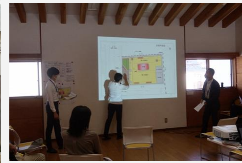
【ワークショップの様子】