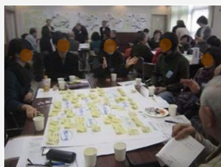
【ワークショップの様子】