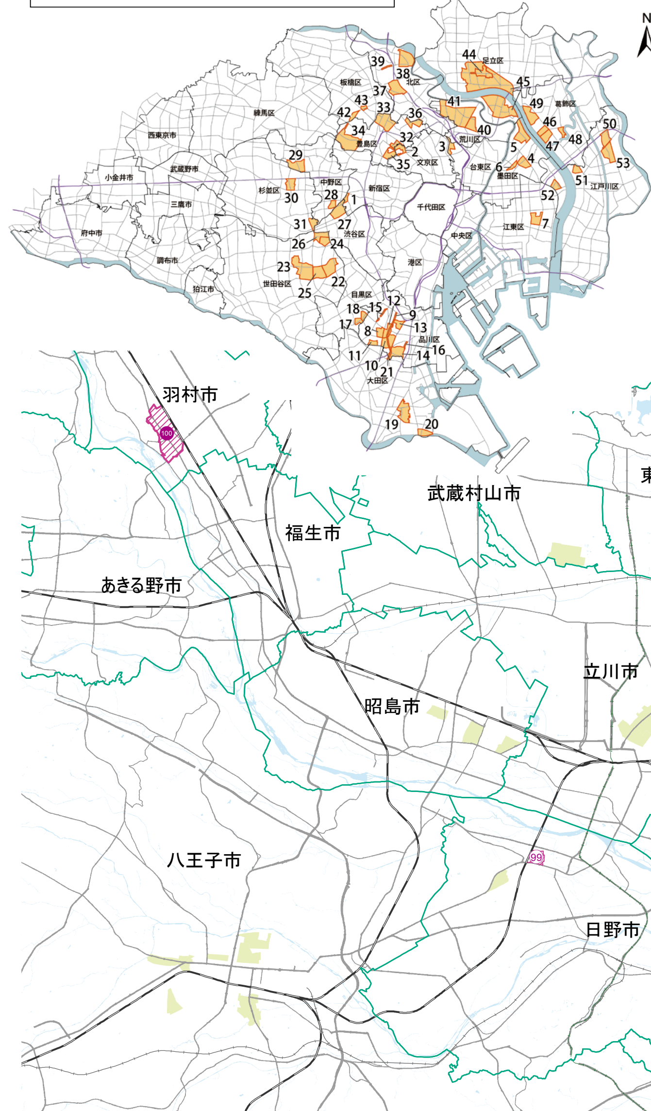
重点整備地域(不燃化特区)位置図