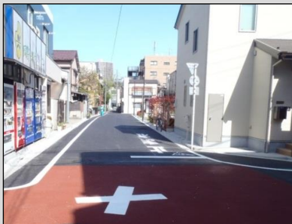
図 3-4 防災生活道路の整備例