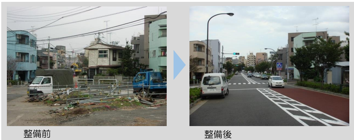
図 3-2 一般延焼遮断帯の整備例