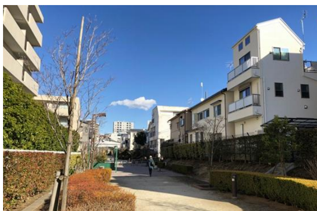
開かれた緑道空間の整備