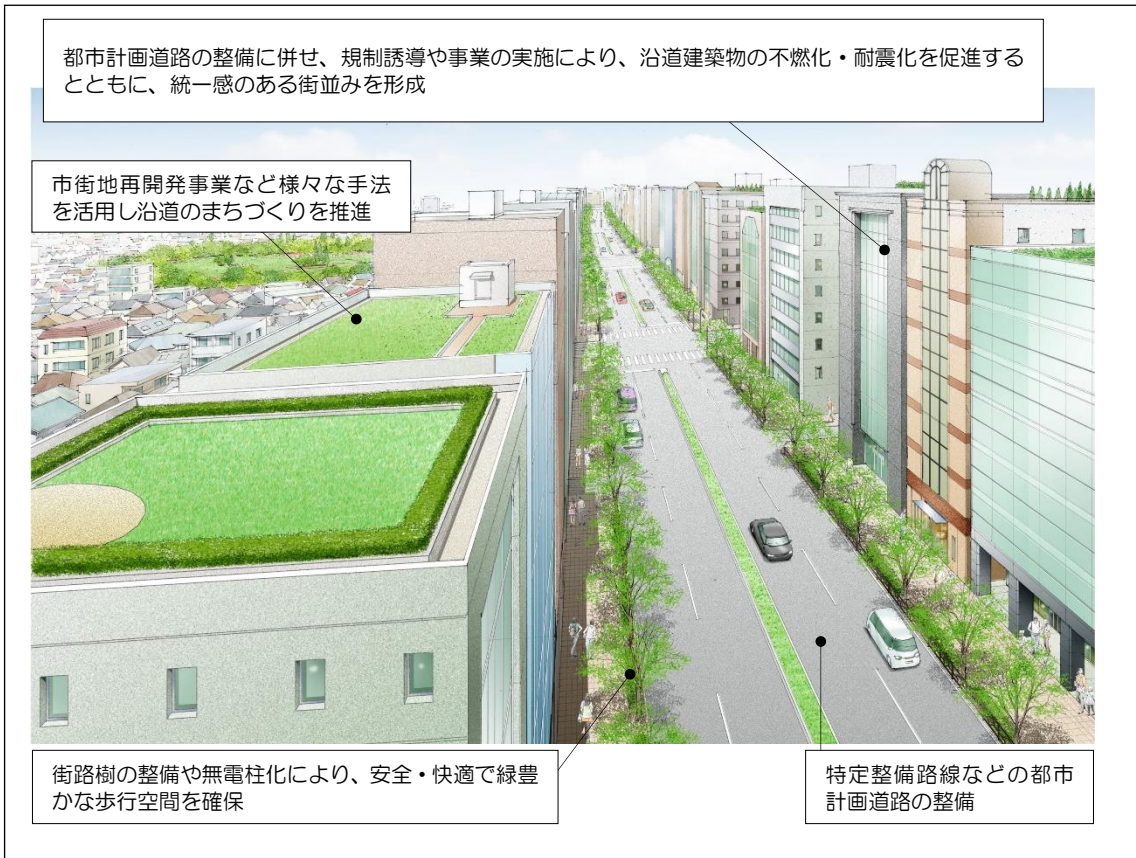
図 3-1 延焼遮断帯の整備イメージ