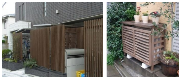
木の素材感を意識したファサード、格子による目 隠し、軒先の緑などによる風情ある街並みの演出