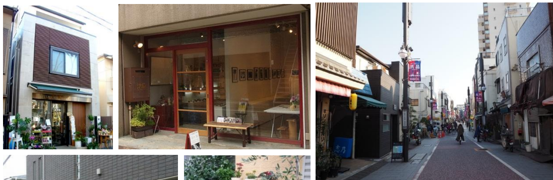
電線類の地中化、伝統色を用いた ひま 庇、外装材、 街路灯の意匠の工夫などによる街並みづくり