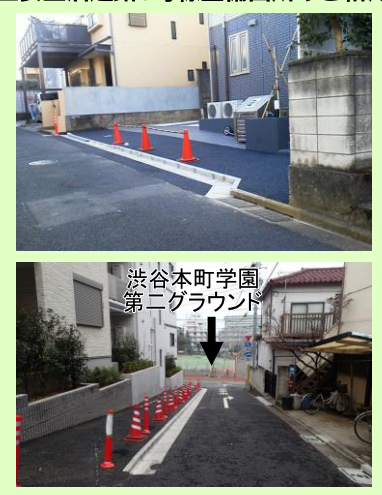
主要生活道路8号線整備箇所のご紹介