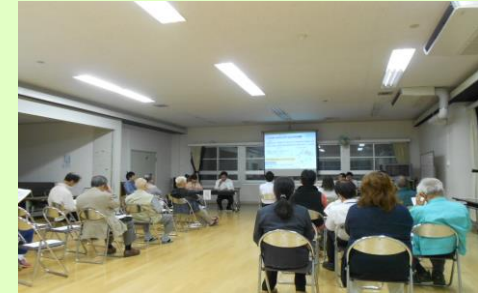
意見交換会の様子(参加者:14名)