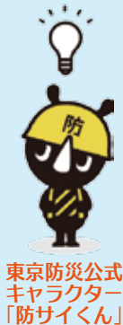
東京防災公式キャラクター「防サイくん」